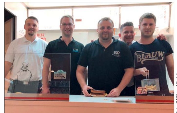
Das Team der CADSpeed-Roadshow im Deutschen Currywurst Museum Berlin

Informationen und Anmeldung unter roadshow.cad-speed.de